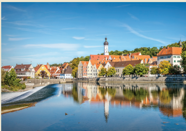
Die malerische Altstadt von Landsberg am Lech