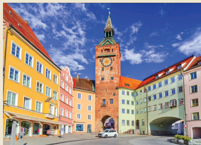
Uhrturm im Zentrum, Landsberg am Lech

Die Kursliteratur erfordert ein fortgeschrittenes Blockflötenspiel. Das Notenmaterial werden wir Dir vor Kursbeginn zur selbständigen Vorbereitung per Mail zuschicken.